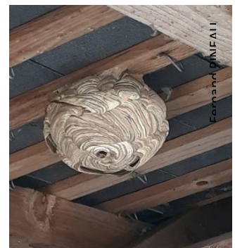
Frelon asiatique - Yamile Garcia