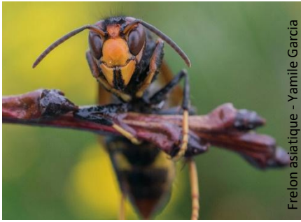
Frelon asiatique - Yamile Garcia